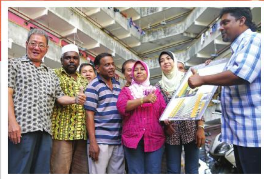
Projek pengecatan semula PPR Jalan Sungai.