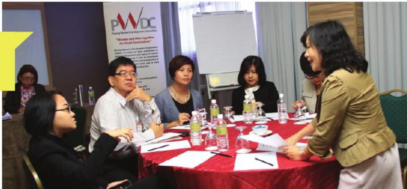
Sesi bengkel di Forum Lean IN Bahasa Mandarin @ Sunway Hotel