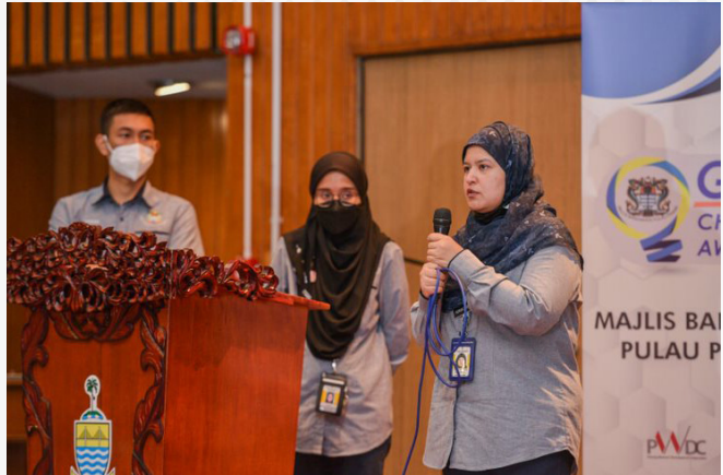
Jabatan Konservasi Warisan

n kekeluargaan yang bapa dan anak-anak s dan mewarna) dan a yang lebih mesra abatan MBPP (kursus warisan)