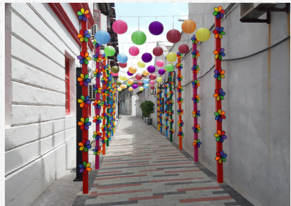
Jabatan Konservasi Warisan