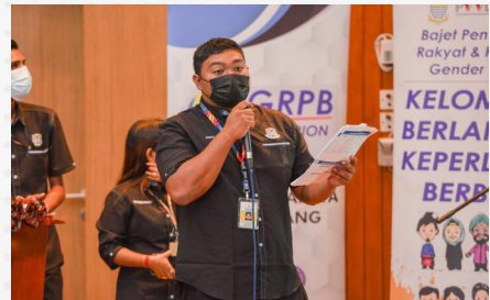
Jabatan Khidmat Pengurusan

Objektif: Mendigitalkan sistem pengurusan latihan