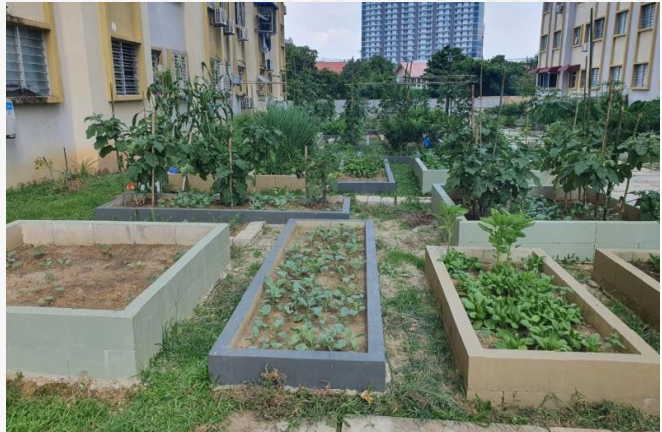
Jabatan Pesuruhjaya Bangunan

berkasakan kemahiran mewujudkan insentif aitan.